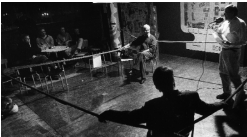
MAGTKAMP - De to kandidater til rektorposten i København har deltaget i en række valgmoder. Her optræder de i en boksering i Studenterhuset. Det er kampledere med mikrofonen...