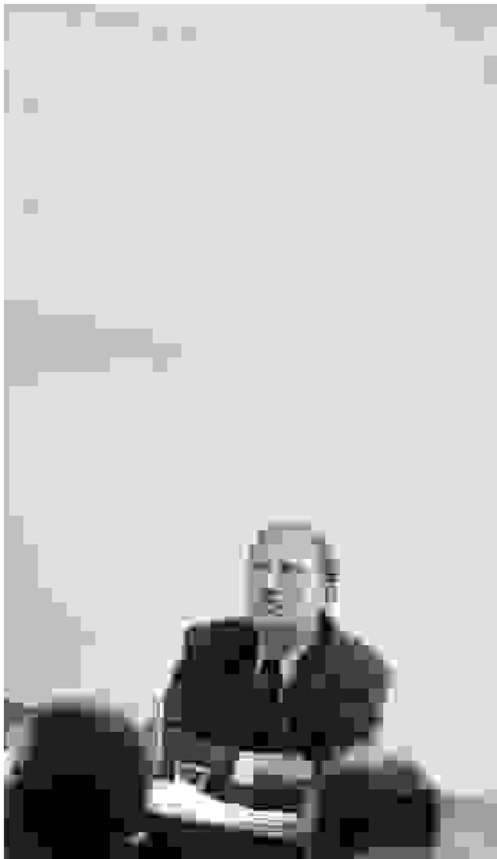
Direktøren i ministeriets Universitetsafdeling fratages nogen indflydelse med det centrale institut, men ministeren får større muligheder for at gribe ind

Dette forslag omfatter ikke umiddelbart universitetslovens område, men i bemærkningerne til lovforslaget står, at tilsvarende bestemmelser vil blive foreslået indført i bl.a. universitetsloven. Påbuddet fortolkes forskelligt: Grundlæggende lyder en indvending på, at truslen om påbud ovenfra vil få de evaluerede til at indføre større selvcensur. Selvevalueringerne ville således ikke længere være selvkritiske – og dermed et dårligere internt arbejdsredskab.