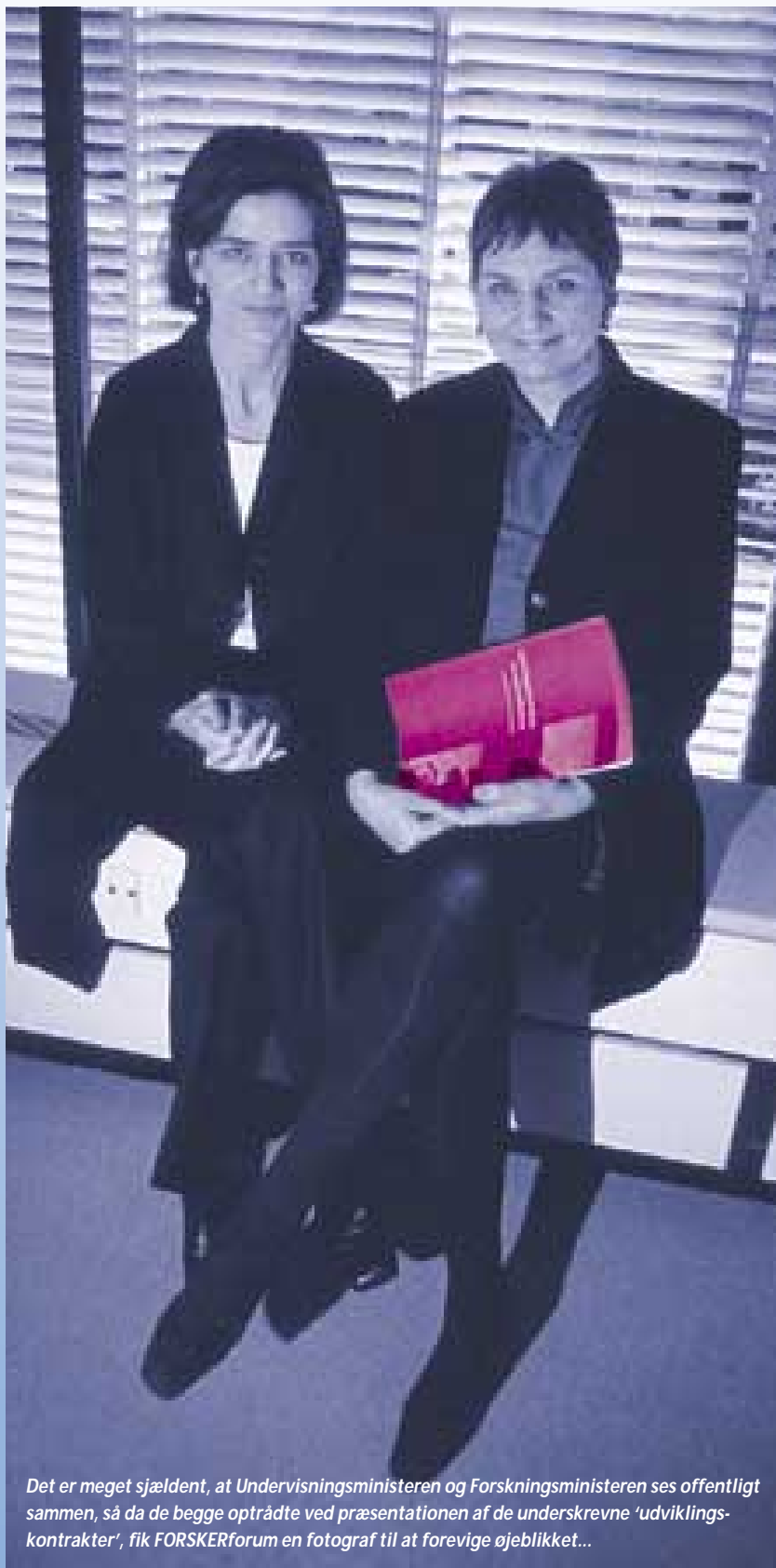
Det er meget sjældent, at Undervisningsministeren og Forskningsministeren ses offentligt sammen, så da de begge optrådte ved præsentationen af de underskrevne 'udviklingskontrakter', fik FORSKERforum en fotograf til at forevige øjeblikket...

“Jeg kan ikke sige det mere præcist ...”