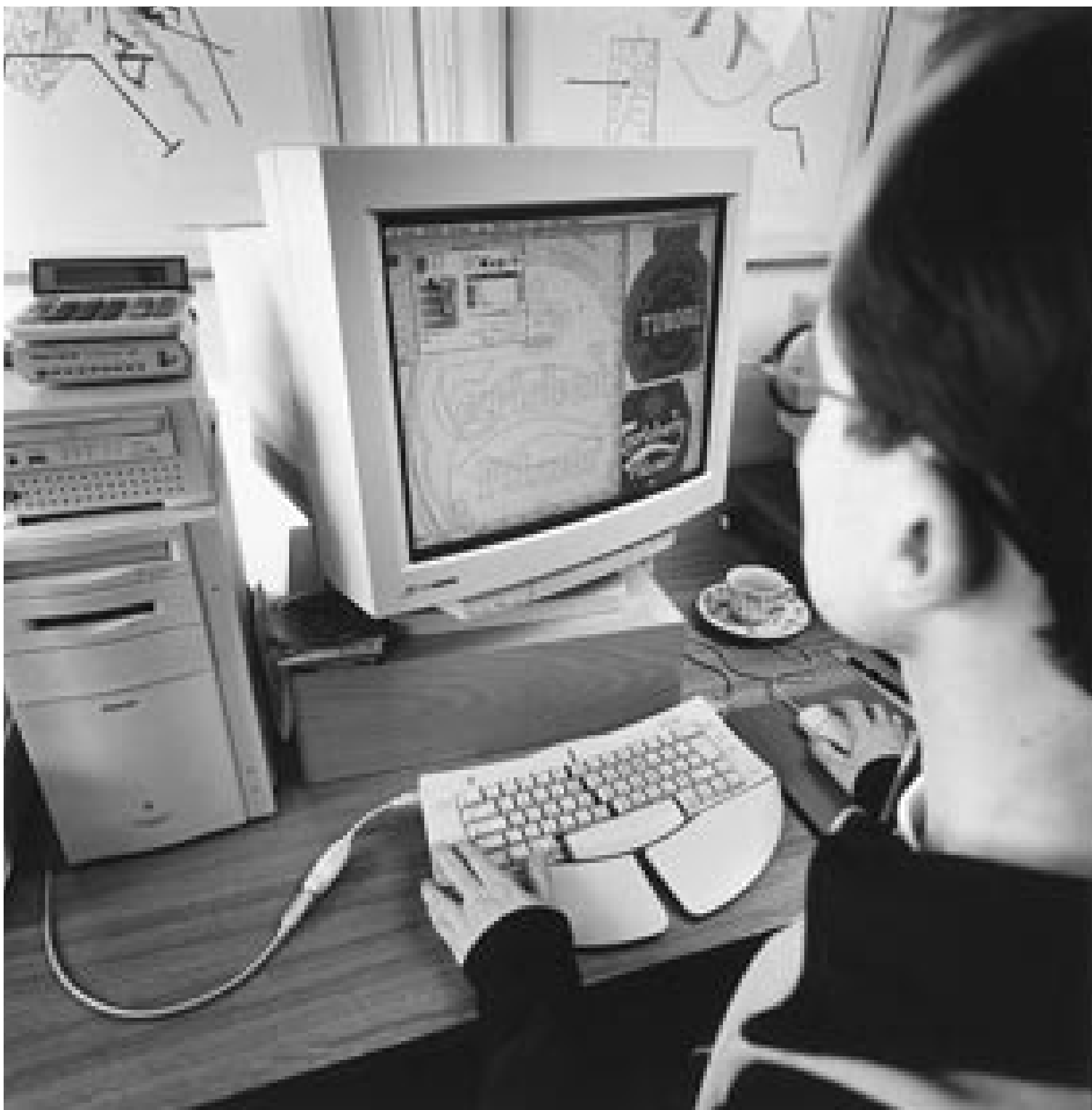
Vidensamfundets vækstområder handler om IT og kommunikation, design, tegnteorier og ikke bare om de hårde naturvidenskaber ...

andre. Det betyder, at man må give design, medier og kommunikation en mere fremtrædende rolle. ”