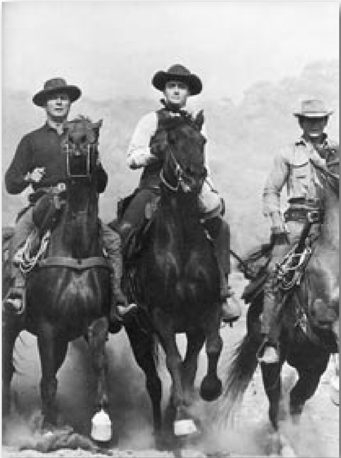
Rigtige cowboys ridder mod vest – eller mod øst?

de ligestiller ens patriotisme med enighed med regeringens politik. Men du kan faktisk godt være en patriot og uenig med regeringen. I et demokrati er uenighed den oprigtigste form for patriotisk smigren”.