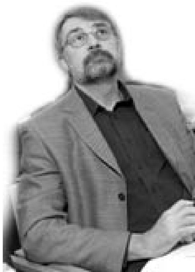
Århus' nye dekan kigger længselsfuldt efter politiske initiativer, der kan hjælpe til med at løse naturvidenskabens problemer ...

"Politikerne kan love bedre bevillinger, hvis universiteterne går med på nye ledelsesformer. Men jeg tror ikke på, at et sådant skifte alene vil føre til stærkt øgede bevillinger. Så ændringer skal alene begrundes sagligt og fagligt ..."