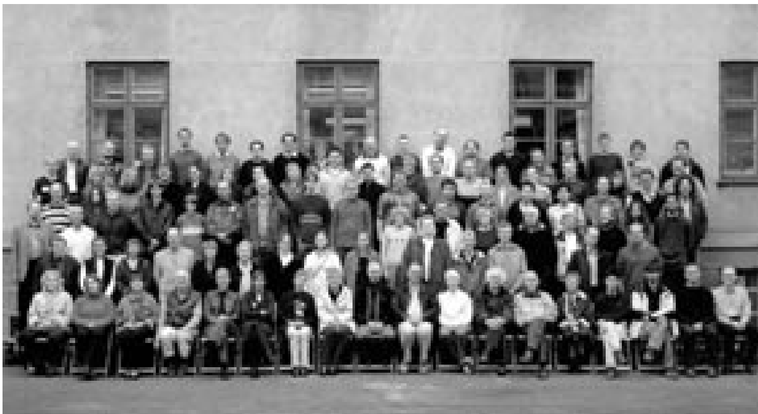
Yngre og ældre mellem hinanden på Niels Bohr, men mange af de unge har ikke udsigt til en fast stilling, mens nogle ældre ved, at de skal gå af om 5-7 år.