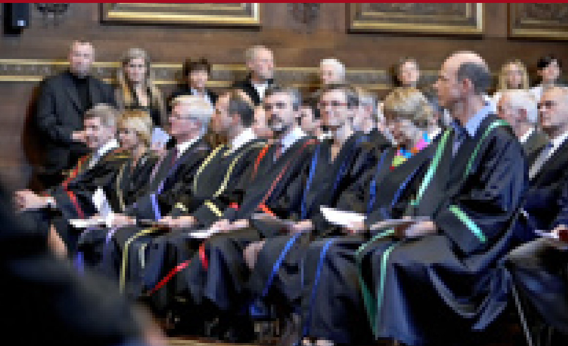
Rektorer, dekaner og institutledere kan se frem til sværere lønforhandlinger i fremtiden