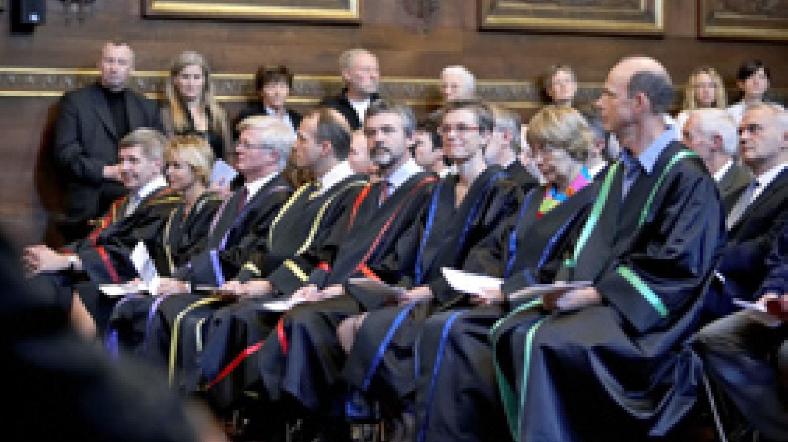
Stemmingsbillede fra det klassiske universitetstraditioner: KUs årsfest

Managementfolk vil sige, at de hermed mister incitamentet – og bliver dovne nulfor-skere?